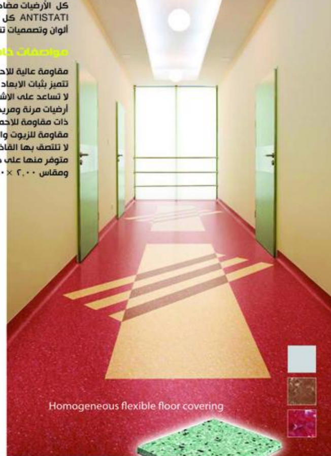
Homogeneous flexible floor covering