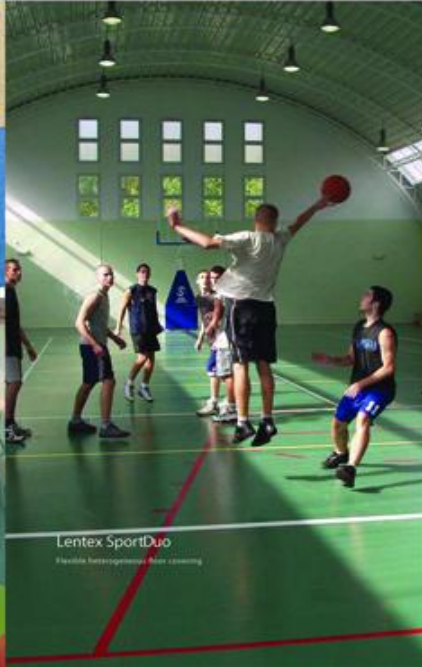
Lentex SportDuo flexible heterogonous floor covering